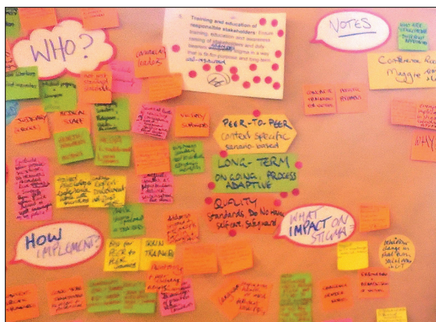
Exhiba un panel de ideas para encontrar formas de capacitar a todos los

En Wilton Park, el Ministerio de Asuntos Exteriores y del Commonwealth del Reino Unido patrocinó un programa estimulante y exigente a la vez, en el que los participantes se vieron involucrados en una agenda centrada en la iniciativa de prevención de la violencia sexual consistente en la elaboración de un plan de acción para hacer frente al estigma. Los invitados acudieron con una amplia gama de experiencias para elaborar una estrategia encaminada a una acción global contra la violencia sexual en los conflictos.