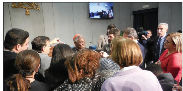
Conferencia de prensa en la Sala Stampa Vaticana para promover la carta del Papa Francisco sobre la Paz y la No violencia. El Cardenal Turkson habló del vasto alcance del documento en un mundo con muchas zonas en graves conflictos. El Arzobispo Tomasi se refirió a las dimensiones personales y locales del mensaje.

Para mayor información sobre el comunicado práctico e inspirador de este taller, sírvanse tomar contacto con la Oficina de JPIC en la dirección: jpicroma@gmail.com .